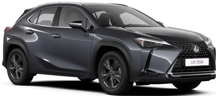
Paveikslėlis - iliustratyvus pobūdžio