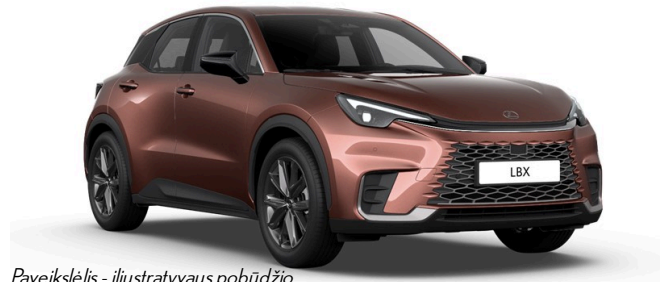
Paveikslėlis - iliustratyvus pobūdis