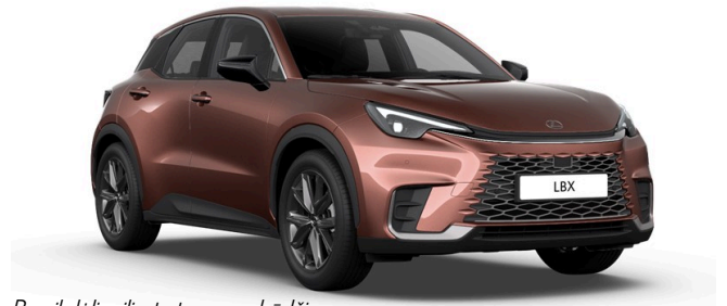
Paveikslėlis - iliustratyvus pobūdžio