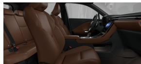
Saddle Tan Semi-Aniline leather seats (LA40)