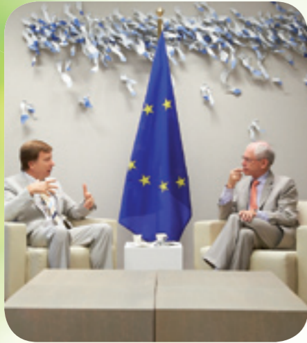
Herman Van Rompuy