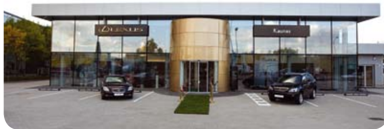
Oficialusis TOYOTA ir LEXUS atstovas Kaune UAB „AUTOTOJA“ šių metų spalio 2 d. atidarė naujį ir pirmąjį Lietuvoje atskirą prabangių automobilių serviso bei salono kompleksą LEXUS KAUNAS

LEXUS standartai, kurie taikomi visose šių automobilių ekspozicijose ir priežiūros stadijose, yra ypatingi, todėl tikslinga apmokyti personalą - tiek aptarnaujančius, tiek techninius darbuotojus - dirbti su šios markės automobilių modeliais. Atskiro LEXUS KAUNAS serviso naudą pajus ir klientai. Šiuo metu įmonės servise aptarnaujama apie 1000 automobilių per mėnesį, todėl persikrūčius jų srautą, sumažės laukiančiųjų eilė. Naujasis kompleksas yra pirmasis Lietuvoje, turintis atskirą specializuotą LEXUS automobilių servisą.