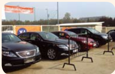
Pirmąją parodos dieną, paskelbtą VIP klientų diena, parodos svečiai galėjo išmėginti naujausius hibridinius Lexus GS450h, Lexus RX400h ir Lexus LS600h automobilius

Džiaugiamės, kad susumavus visus rezultatus