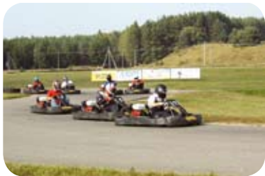
2008 m. Aukštadvario kartodromo Ištvermės lenktynių Taurėje dalyvavo UAB „Autotoja“ komanda - „Autotoja Racing“

Kad ir kaip bebūtų, sveikiname savo komandą iškovojus 12 – ają vietą. SVARBU DALYVAUTI, O NE LAIMĖTI!