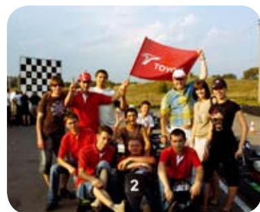
Savo komandą palaikyti į Aukštadvarį atvykęs pakankamai gausus bendradarbių būrelis beveik visas varžybas mojavo vėliavomis ir drąsino ją