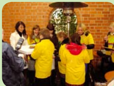
Pagrindinėje ekologiškiausio laivo nominacijoje nugalėtoju pripažintas Veršvų vidurinės mokyklos ketvirtokų suręstas laivelis