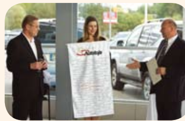
Šiuo metu įmonėje dirbantys 75 darbuotojai bendrovės vadovams dovanavo vėliavas, kuriose išsiuvinėti visų šiuo metu įmonėje dirbančių darbuotojų vardai ir pavardės, simbolizuojančias kolektyvo darną bei vieningumą.

jai bendrovės vadovams dovanavo vėliavas, kuriose išsiuvinėti visų šiuo metu įmonėje dirbančių darbuotojų vardai ir pavardės, simbolizuojančias kolektyvo darną bei vieningumą.