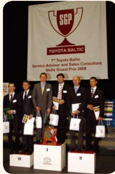
Šiemet, rugsėjo 4 dieną, Toyota Baltic suorganizavo Pabaltijo Toyota atstovybių Pardavimų vadybininkų ir Techninio aptarnavimo specialistų įgūdžių Grand Prix - „Skills Grand Prix 2008“