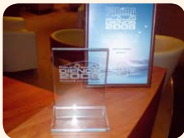
Naujasis LEXUS ISF parodoje „Kauno autodienos 2008“ laimėjo parodos automobilio rinkimus

laimėtoju paskelbtas naujasis Lexus IS - F! Šis automobilis, sužavėjęs ne vieną sportiškų automobilių mėgėją, pasižymi idealiomis techninėmis savybėmis, kurios užtikrina puikų automobilio valdomumą važiuojant įvairiais greičiais. Pažangi aerodinamika, F1 pavyzdžiu sukonstruotas sudėtinis aptakus kėbulo apachios apvalkalas privers pajusti šio automobilio vairavimo malonumą.