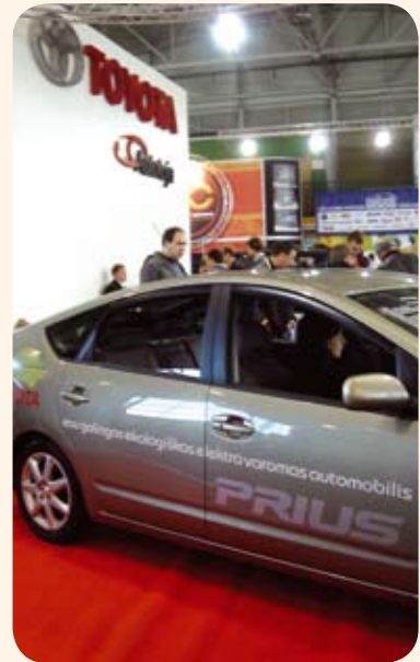
TOYOTA stendo svečiai galėjo apžiūrėti ekologišką Prius

tomobilį! „Kauno autodienos“ buvo puiki galimybė parodyti karščiausias naujienas, pristatyti Lietuvoje pasirodžiusius automobilius ir įrangą, gyvai pabendrauti su automobilių ir motociklų pasauliu susidomėjusiais lankytojais. Dėkojame visiems, apsilankiusiems mūsų stende, taip pat kviečiame apsilankyti mūsų salone, iš arčiau apžiūrėti ir išbandyti Jus dominančius modelius.