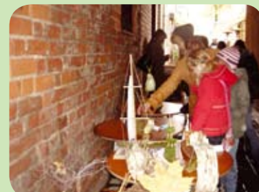
Šių metų spalio 17 dieną (penktadienį) Kauno Senamiesčio bendruomenės centras surengė moksleivių darbų parodą „Eko laivas 2008“