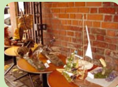
Parodoje buvo eksponuojami daugiau nei 50 moksleivių iš Kauno miesto ir Kauno rajono sukurti ekologiški laiveliai