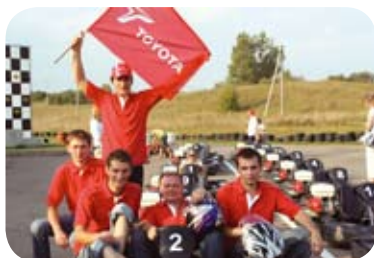
„Autotoja Racing“ komanda