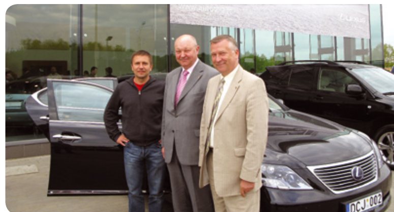
„AUTOTOJA“ pakvietė seniausio Lietuvoje Rotary klubo narius susipažinti ir išbandyti kelyje hibridinius „Lexus“ automobilius