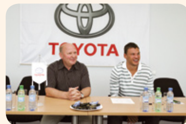
Šių metų birželio 28 d. Toyota atstovybėje UAB Autotoja lankėsi krepšinininkas Šarūnas Jasikevičius