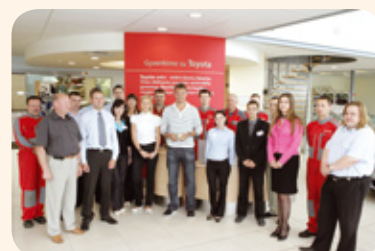
Įmonės darbuotojai įsiamžino drauge su Šaru bendroje nuotraukoje