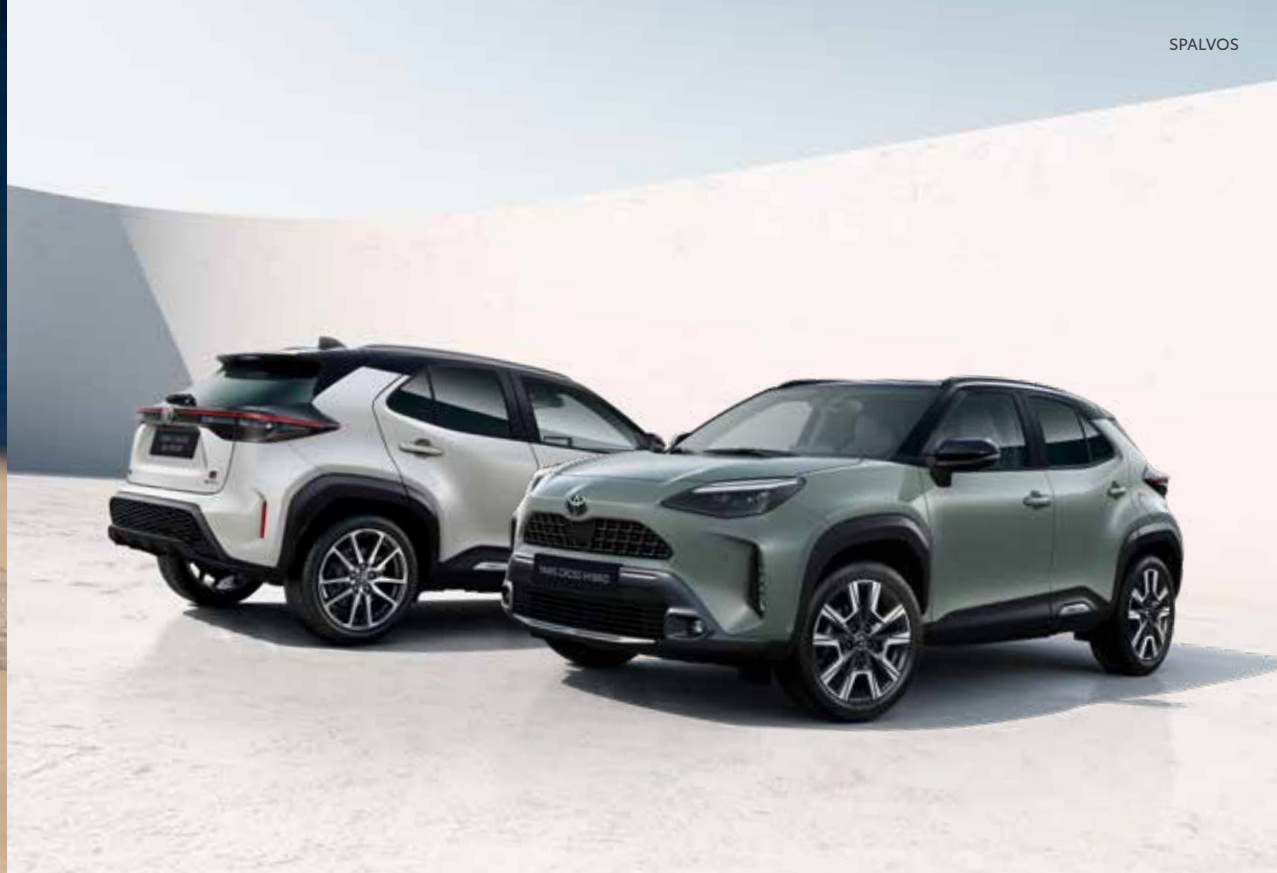
Vienspalviai Yaris Cross variantai