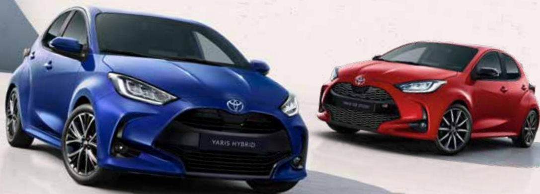
Vienspalviai Yaris variantai