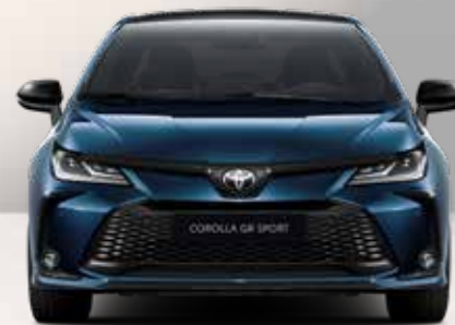
Corolla sedano kėbulo spalvų variantai

Corolla sedano kėbulo spalvų paletę sudaro įvairūs vienspalviai ir dvispalviai variantai. Į ją įtraukti nauji Midnight Teal ir Ash Grey atspalviai, įkvėpti naujausių dizaino, mados ir architektūros tendencijų.